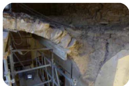
Réfection de la sacristie

La façade a été reprise, avec notamment le remplacement de quelques pierres. Ce sont les travaux les plus visibles. La rénovation intérieure, qui la rendra plus accueillante (peinture, chauffage, etc.) attendra encore quelques années, mais l'essentiel est fait et elle restera debout pour quelques siècles encore, nous l'espérons !