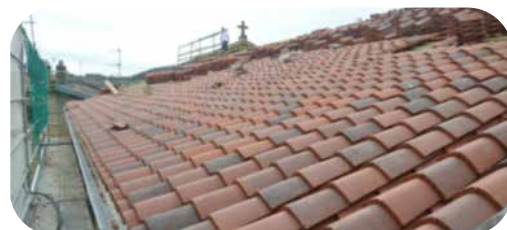
Couverture en tuiles

Au printemps, l'inauguration officielle sera organisée afin de remercier l'ensemble des donateurs, entreprises, agents, et toutes les personnes ayant contribué à la réussite de ces travaux.