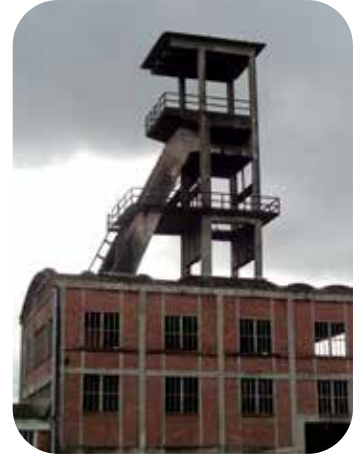
Le chevalet de la mine de Noyant-d'Allier. Le musée est installé dans les bâtiments de la mine.

Notons qu'entre les deux villages se trouve un minuscule hameau nommé le Beaujolais !