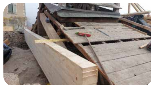
Renforcement du pied du clocher

Il a donc été installé des micropieux permettant de maintenir cette salle, et des murs et dalles en béton afin de consolider de l'intérieur la sacristie. Un chaînage a aussi été réalisé sur le tour de l'église puis l'ensemble de la toiture a été repris. Le pied du clocher a été renforcé grâce à l'installation de poutres.