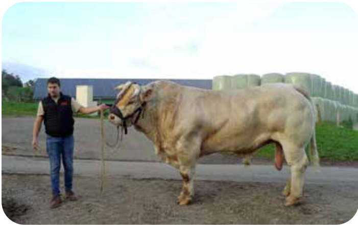
Très authentique représentant de la race charollaise, version châillonaise

La seconde visite était dévolue à une exploitation agricole châillonaise spécialisée dans l'élevage. Trois activités occupent deux générations de la même famille : un élevage de poulets « industriel », un élevage de sangliers (ce qui n'a pas manqué d'étonner bon nombre de visiteurs, car dans de nombreuses régions - comme la nôtre - les sangliers sont nettement en surnombre) et un élevage de charollais de compétition, animaux impressionnants destinés à la reproduction.