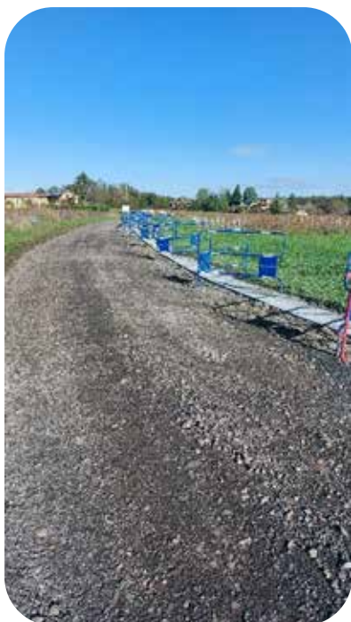
Chemin des grandes terres pendant les travaux

En octobre 2024, des travaux de réfection de la chaussée ont été réalisés sur le chemin des grandes terres au nord de la commune : stabilisation des accotements et création de caniveaux. Le carrefour avec le chemin des granges a été également aménagé afin d'assurer une meilleure visibilité et améliorer la sécurité.