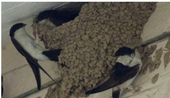
Hirondelle de fenêtre