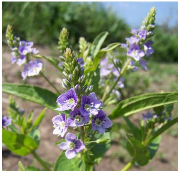
Mourron aquatique (T. Duret)