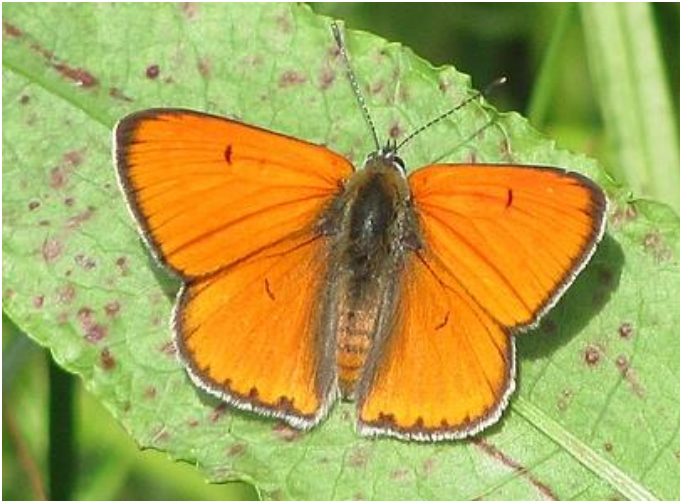
Cuivré des marais ( Lycaena dispar ) (BBMP)

24 espèces ont été validées. Le Cuivré des marais, Lycaena dispar , espèce protégée, était inconnue de la commune.