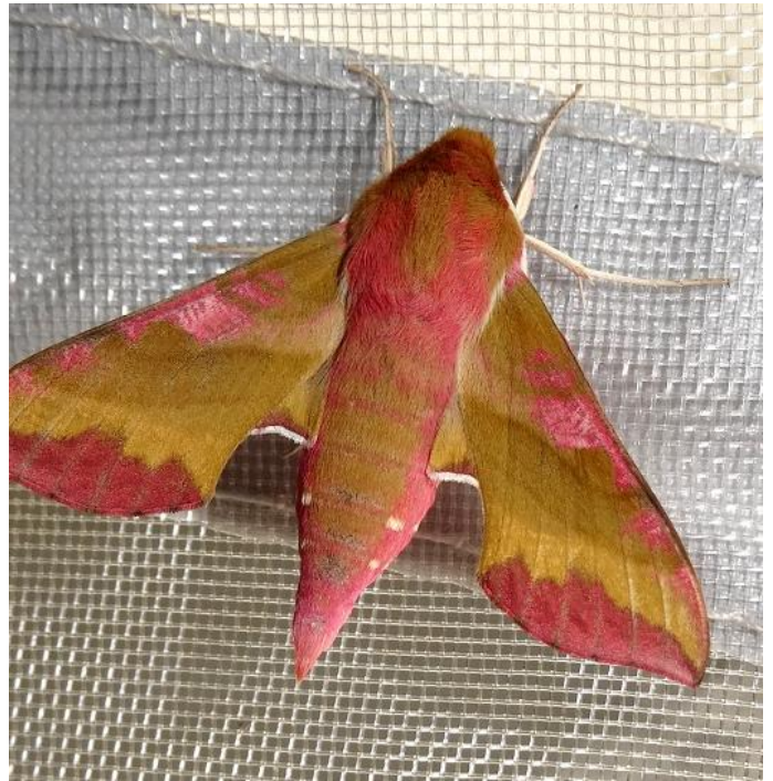
Deilephila porcellus (BBMP)

Trois sites de piégeage lumineux ont permis d'attirer 64 espèces réparties sur 8 familles. On retiendra le Sphinx du tilleul ( Mimas tiliae ), le Sphinx du pin ( Sphinx pinastri ), le Petit Sphinx de la vigne ( Deilephila porcellus ), l'Hameçon ( Watsonalla binaria ), la Phalène printanière ( Hemistola chrysoprasaria ), la Phalène du noisetier ( Angerona prunaria ), la Nonne ( Lymantria monacha ), l'Écaille fuligineuse ( Phragmatobia fuliginosa ), l'Écaille villageoise ( Epicاليا villica ), le Trapèze ( Cosmia trapezina ), le Casque ( Noctua janthina ), la Noctuelle de Duméril ( Noctua dumerilii ), la Sésie de l'oseille ( Pyropteron chrysidiformis ), la pyrale du buis ( Cydalima perspectalis ).