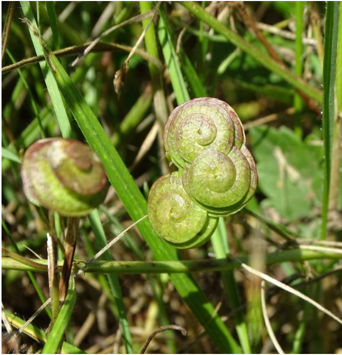
Luzerne orbiculaire (T. Duret)