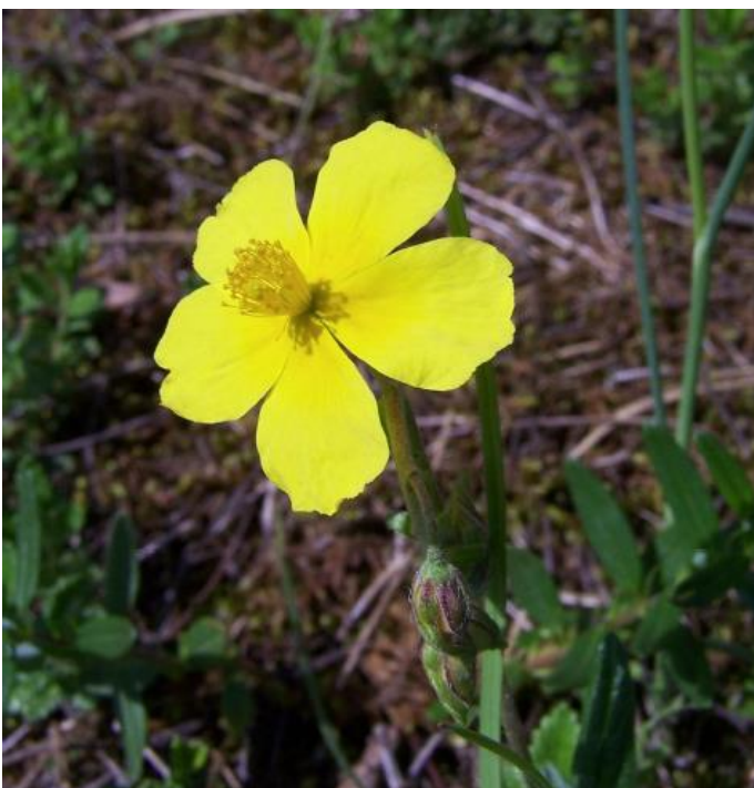
Hélianthème à feuilles arrondies (T. Duret)